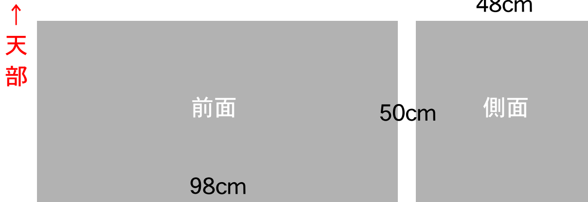
ピラー三脚 : (98x48x50cm/31kg)