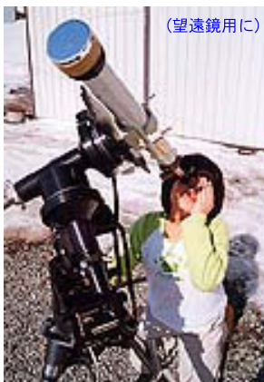
(望遠鏡用に) アストロソーラー (双眼鏡用に)

アストロソーラー (バーダー) : www.kkohki.com/Baader/astrosolar.html SEV-ND5 (サングラス) : www.kkohki.com/products/SEV.html