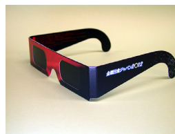
SEV-ND5 (サングラス / 1枚) 完売