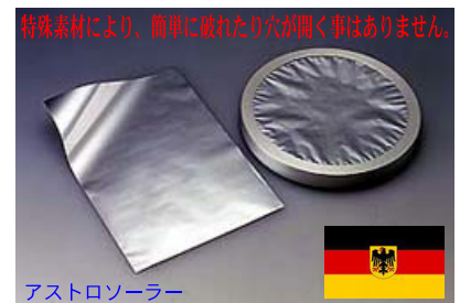
特殊素材により、簡単に破れたり穴が開く事はありません。