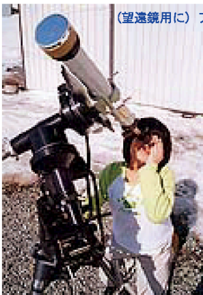
(望遠鏡用に) アストロソーラー (双眼鏡用に)

アストロソーラー (バーダー) : www.kkohki.com/Baader/astrosolar.html SEV-ND5 (サングラス) : www.kkohki.com/products/SEV.html 金属メッキガラスフィルター : www.kkohki.com/products/sunfilter.html