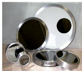
口径 6cm 用 (各種あり) ¥14,800- から (一例)