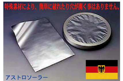
アストロソーラー